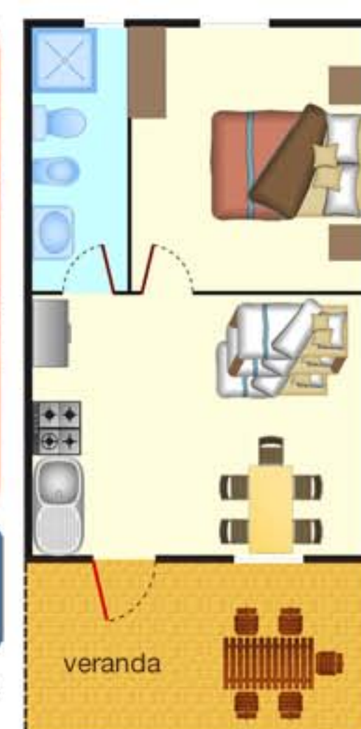
BILOCALE m 2 lordi 46

Pulizia Finale Obbligatoria Die Reinigung am Ende des Aufenthaltes ist Pflicht - End of stay cleaning obligatory - Nettoyage final obligatoire